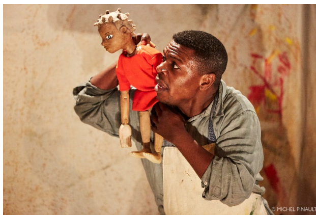
Mwana et le secret de la tortue - © Michel Pinault