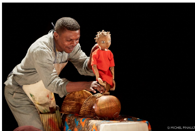
Mwana et le secret de la tortue - © Michel Pinault

Catégorie : conte, marionnettes, théâtre d'objets et ombres