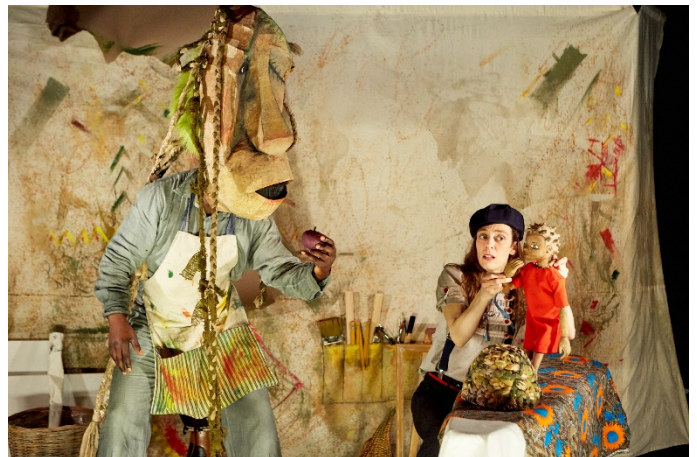
Mwana et le secret de la tortue