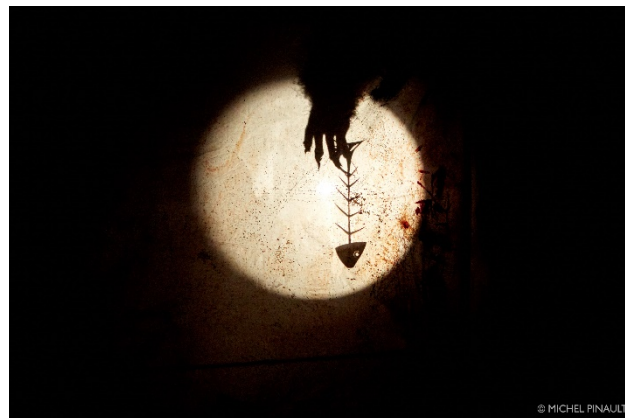
Mwana et le secret de la tortue

Petits-Bonheurs Abitibi – La Sarre, Senneterre, Lac Simon, Val d'or 15 au 19 mai 2018