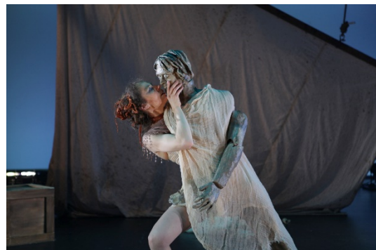
La Petite sirène – Mémoire-crédation UQAM - © Marc-Andrée Goulet