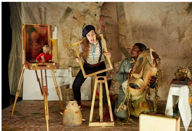
Mwana et le secret de la tortue - © Michel Pinault