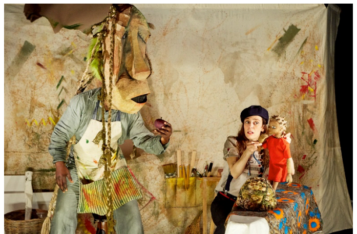
Mwana et le secret de la tortue - © Michel Pinault