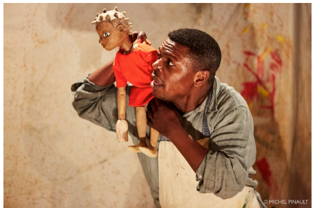
Mwana et le secret de la tortue - © Michel Pinault