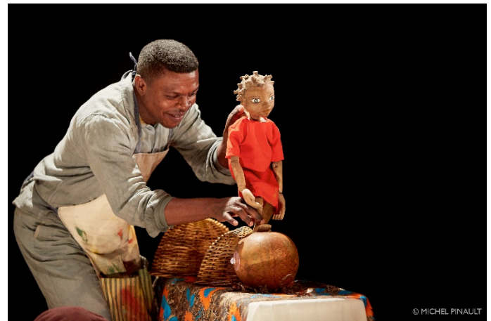
Mwana et le secret de la tortue

Catégorie : conte, marionnettes, théâtre d'objets et ombres