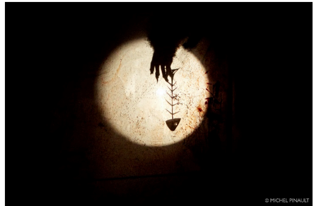
Mwana et le secret de la tortue - © Michel Pinault

Petits-Bonheurs Abitibi – La Sarre, Senneterre, Lac Simon, Val d'or 15 au 19 mai 2018