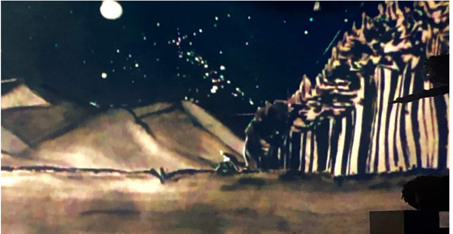
Projection table lumineuse: Laboratoire de recherche et création (Août 2021). Dessins: Gaëlle Bridoux

Nous voulons à notre tour faire une lecture très personnelle de ce conte social et écologique qui recèle en lui tant de possibilités de théâtralisation et d'émotions.