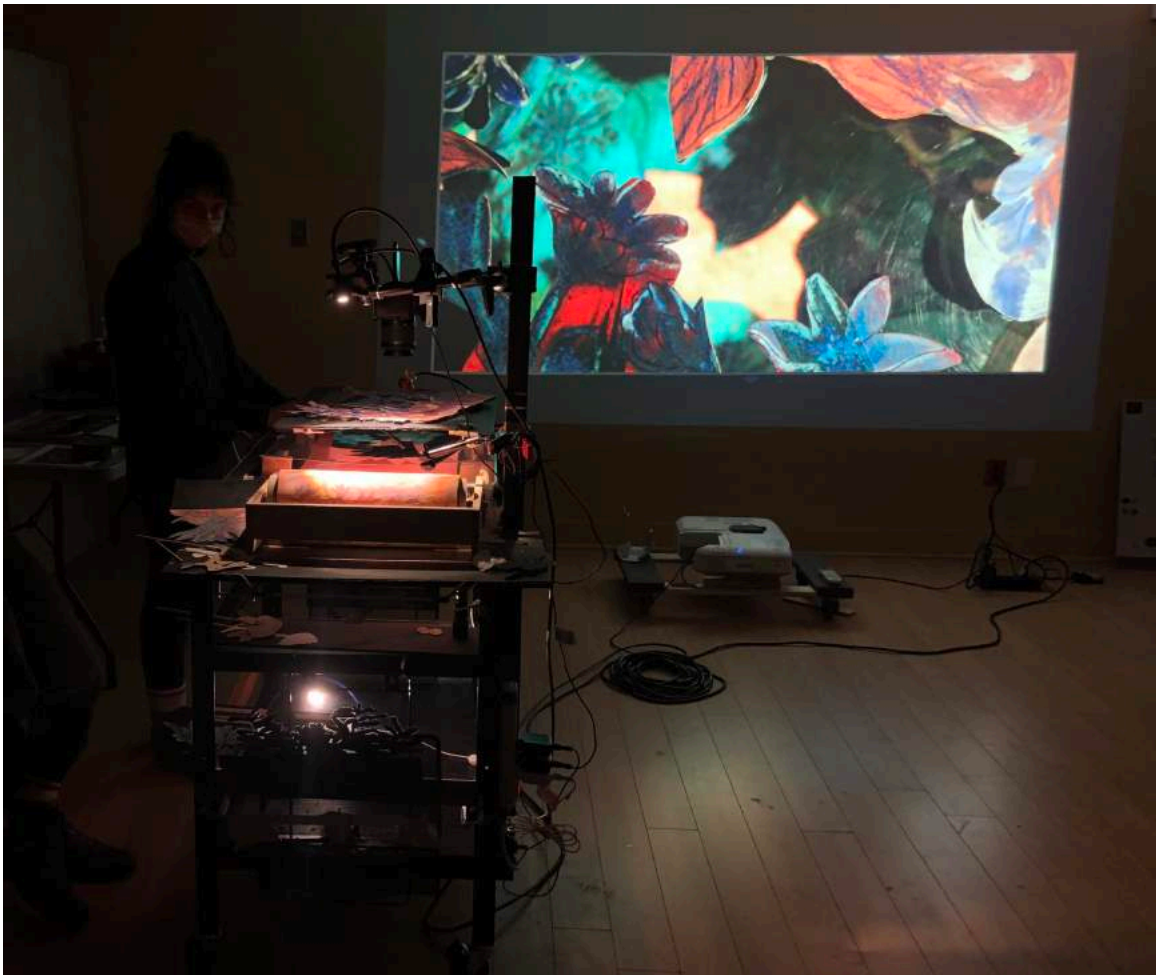
Projection sur écran à partir de la table lumineuse. Laboratoire de recherche et création (Octobre 2020).

Les résidences de création auront permis de mettre en place les éléments artistiques avec lesquels nous souhaitons travailler, c'est-à-dire la table lumineuse avec une animation « marionnettique », la projection ( mapping vidéo sur écrans fixes et mobiles) et la marionnettes en 3D à prise directe, qui s'inscrit dans un univers graphique inspiré de la bande dessinée.